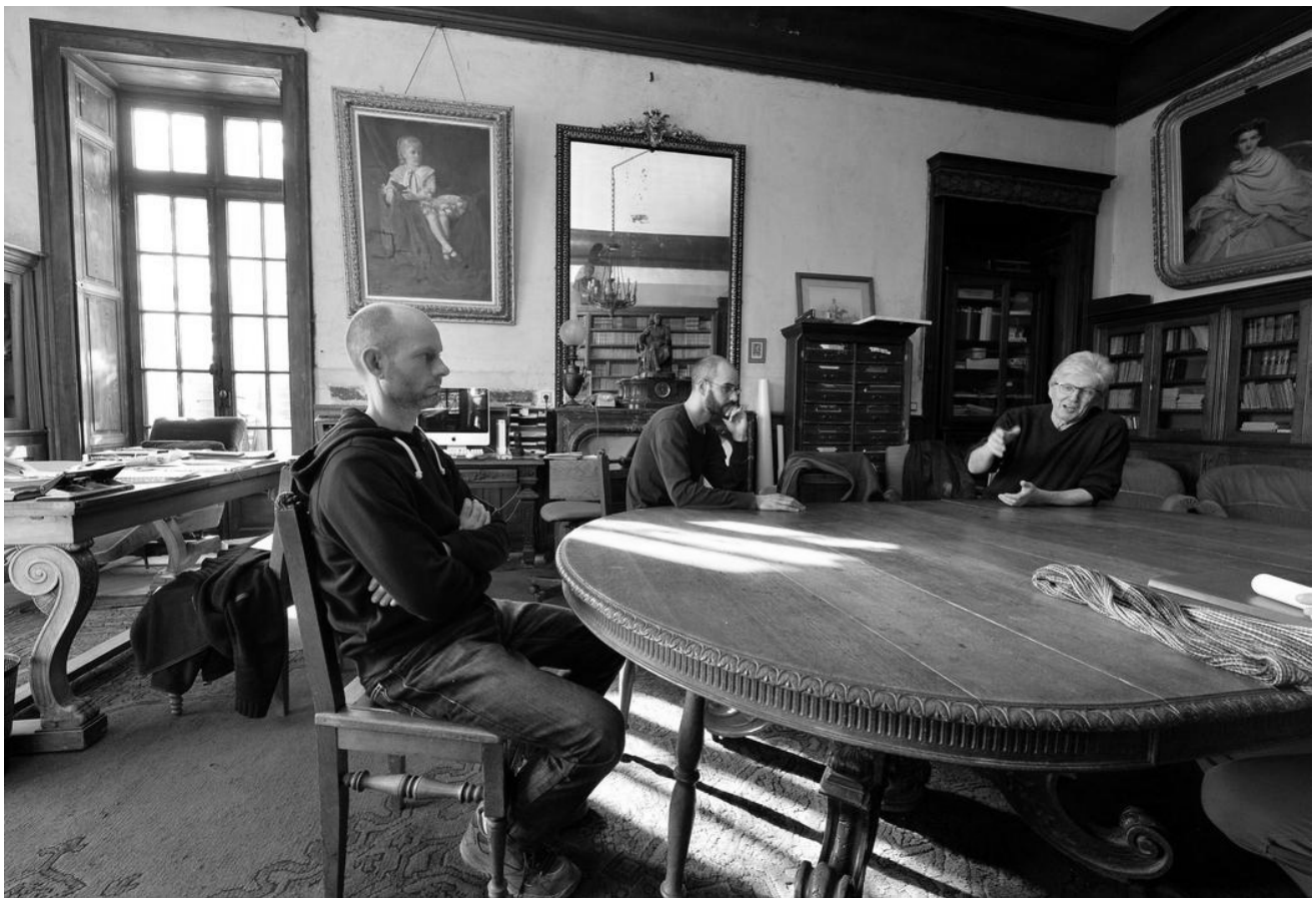
Table ronde. Depuis 40 ans, les membres des associations du château et du domaine de Ligoure se réunissent régulièrement dans la bibliothèque du château, autour de cette grande table ronde en bois. C'est là que prend vie la démocratie participative qui caractérise la vie sur le domaine. Un lieu de remue-méninges et de responsabilité collective.